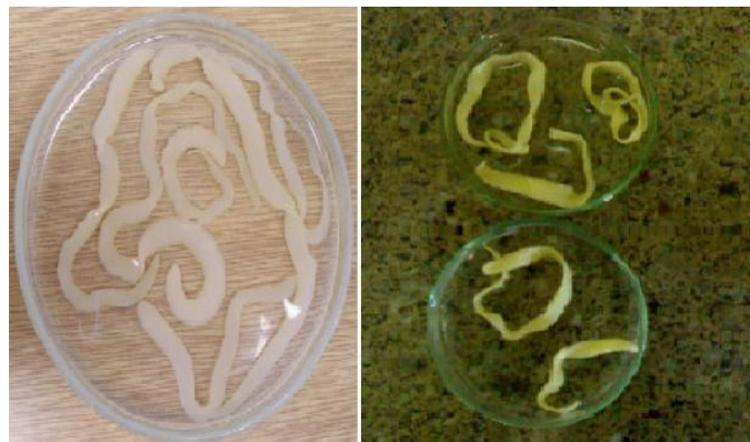
نگاره ۳- پلوروسرکوئید انگل لیگولا اینتستینالیس در داخل پتری دیش