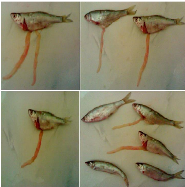
نگاره ۴- ماهیان آلوده به مرحله پلوروسرکوئید انگل لیگولا اینتستینالیس