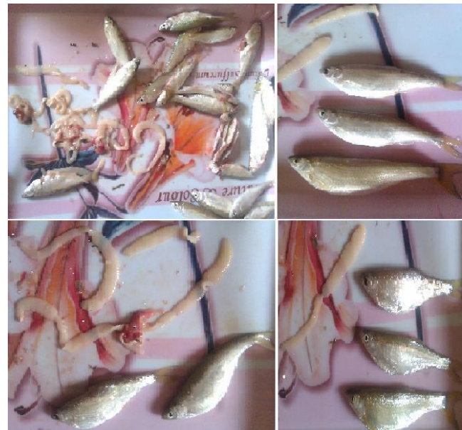
نگاره ۲- ماهیان مورد بررسی و انگل‌های داخل شکم آنها