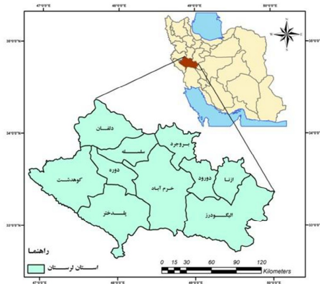
شکل ۱: موقعیت محدوده مورد مطالعه