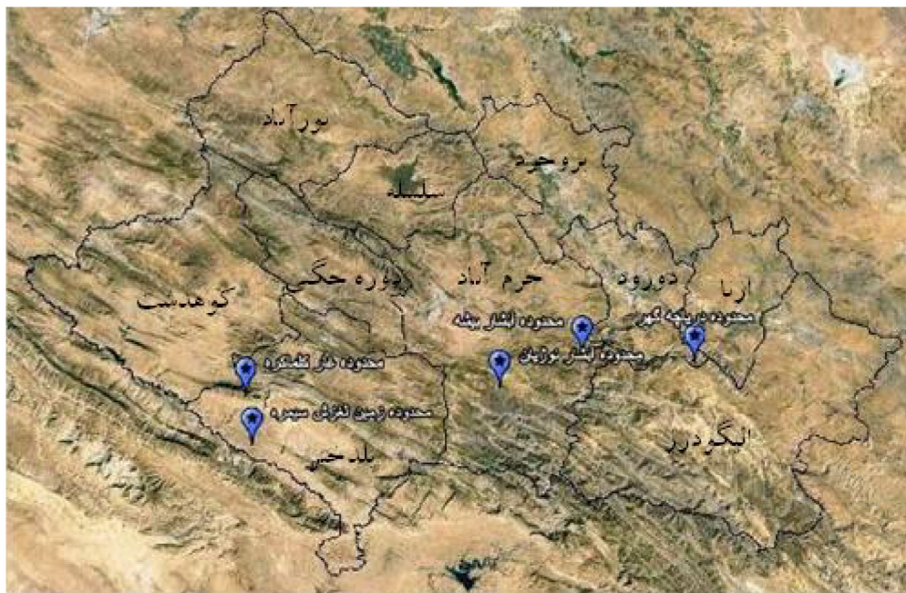
شکل ۲: محدوده‌های پیشنهادی جهت معرفی به عنوان ژئوپارک جهت معرفی در استان لرستان

در بخش پائینی ساختار سلسله مراتبی، گزینه‌های پیشنهادی جهت تعیین محدوده ژئوپارک قرار دارد. این گزینه‌های با توجه به ویژگی‌های زمین شناختی و جنبه‌های زیباشناختی آن، از میان جاذبه‌های فراوان ژئوتوریستی در استان لرستان انتخاب شده‌اند. محدوده‌های مورد نظر علاوه بر اینکه دارای جنبه‌های ژئومورفولوژیک و زمین شناختی می‌باشند، با مرکزیت قرار دادن یک جاذبه شاخص ژئوتوریستی، جذابیت دو چندانی یافته است. از میان گزینه‌های موجود ژئوتوریستی، با توجه به اهمیت آن‌ها و میزان جذابیتی که دارند، ۵ گزینه به عنوان گزینه‌های نهایی احداث ژئوپارک در استان لرستان انتخاب شدند (شکل ۲). لازم به ذکر است که دره شیرز براساس مطالعه یاراحمدی و شرفی (۱۳۹۳) به تنهایی نمی‌تواند به عنوان ژئوپارک معرفی شود، بنابراین در این تحقیق به عنوان یکی از گزینه‌های پیشنهادی در نظر گرفته نشده است.