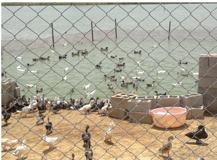
شکل ۲. پرورش توام کپور ماهیان با اردک در مزرعه پرورش ماهی حنطوش زاده (استان خوزستان)

جهت آنالیز آماری از نرم افزار آماری SPSS-17 استفاده گردید. پس از بررسی نرمال بودن داده‌ها با استفاده از آنالیز واریانس یکطرفه (one way ANOVA) اختلاف بین گروه‌ها مورد بررسی قرار گرفت. مقایسه میانگین‌ها در سطح اطمینان ۹۹ درصد انجام شد. در رسم نمودارها و جداول از نرم افزار Excel2007 استفاده گردید.