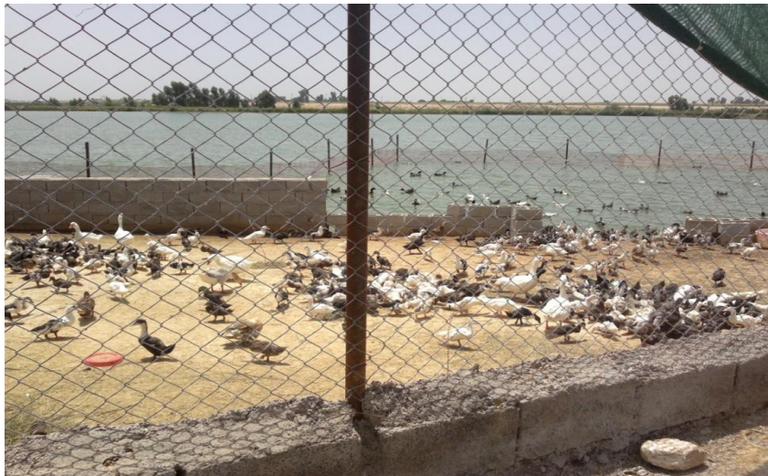
شکل ۱. پرورش توام کپور ماهیان با اردک در مزرعه پرورش ماهی حنطوش زاده (استان خوزستان)

طی دوره پرورش هر ۱۵ روز یک بار پارامترهای شفافیت، دما و pH اندازه‌گیری و ثبت شدند. شفافیت آب به وسیله سی‌سی دیسک با دقت ۰/۵ سانتیمتر اندازه‌گیری گردید. دما و pH بر اساس روش‌های استاندارد به کمک دستگاه دیجیتال ساخت کشور سنگاپور با دقت ۰/۰۱ سنجش شدند (Eaton et al., 2005).