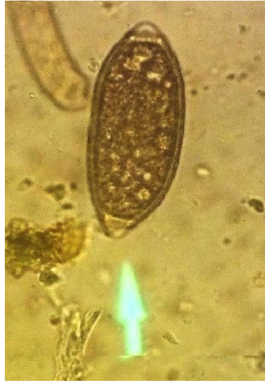
شکل ۱- تخم تریشیوریس سوئیس لیموئی شکل با دو قطب تویی دار مشاهده شده در مدفوع گرازهای منطقه حفاظت‌شده آینالوی استان آذربایجان شرقی با عدسی \times 40 .