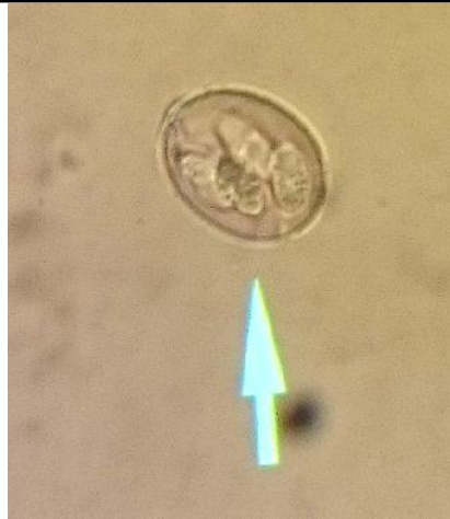
شکل ۷- گونه ایمریا مشاهده شده در مدفوع کل و بزهای منطقه حفاظت‌شده آینالوی استان آذربایجان شرقی با عدسی \times 40 .