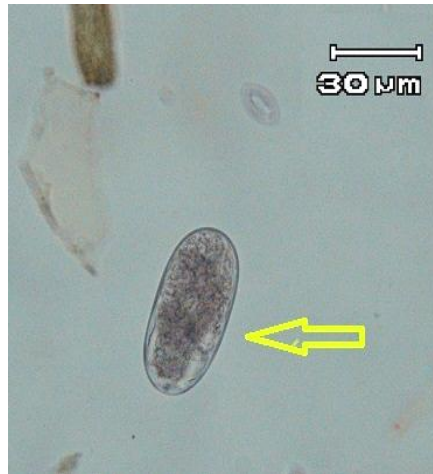
شکل ۲- تخم استرونژیلوئیدس سوئیس بیضی شکل با جدار نازک حاوی نوزاد ضخیم مشاهده شده در مدفوع گرازهای منطقه حفاظت‌شده آینالوی استان آذربایجان شرقی با عدسی \times 10 .