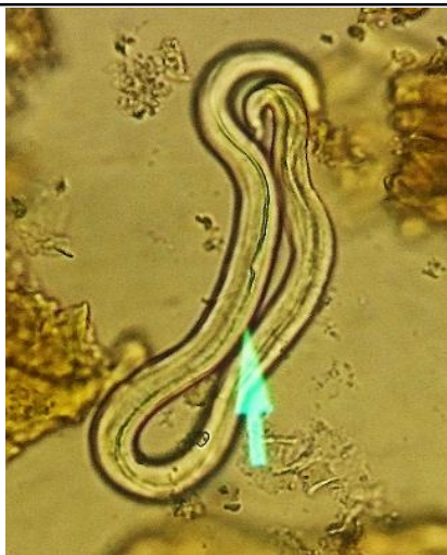
شکل ۵- لارو متاسترونژیلوس/پری با ۰/۳ میلی‌متر طول و انتهای خلفی شدیداً خمیده و گرد و دارای سه لب در قسمت قدامی مشاهده شده در مدفوع گرازهای منطقه حفاظت‌شده آینالوی استان آذربایجان شرقی با عدسی ۱۰×.