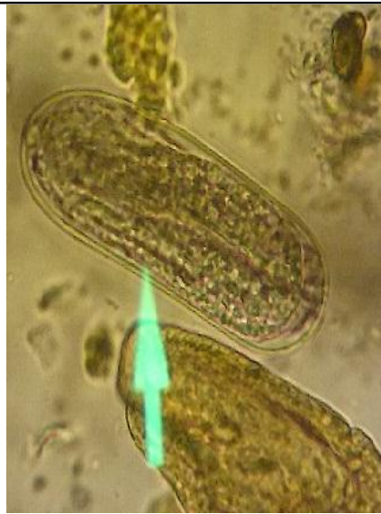
شکل ۳- تخم فیزوسفالوس سکسالاتوس بیضی شکل با پوسته ضخیم و حاوی نوزاد مشاهده شده در مدفوع گرازهای منطقه حفاظت شده آینالوی استان آذربایجان شرقی با عدسی \times 40 .