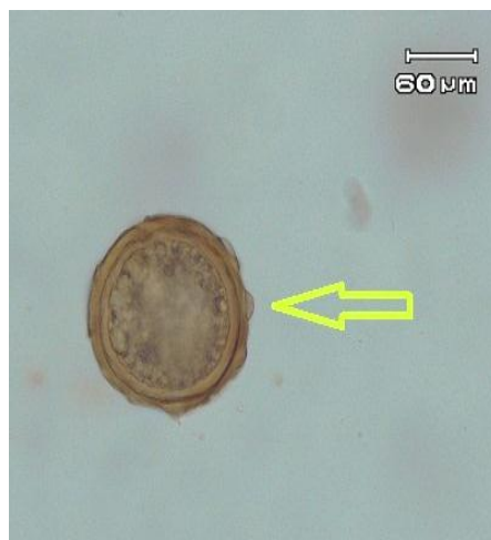
شکل ۴- تخم آسکاریس سووم دیواره خارجی ضخیم و چاله دار مشاهده شده در مدفوع گرازهای منطقه حفاظت شده آینالوی استان آذربایجان شرقی با عدسی \times 40 .