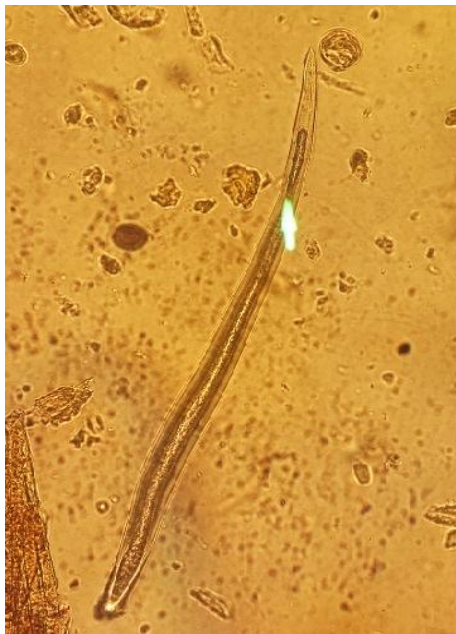
شکل ۸- لارو ریوی مشاهده شده در مدفوع مارال‌های منطقه حفاظت‌شده آینالوی استان آذربایجان شرقی با عدسی \times 40 .