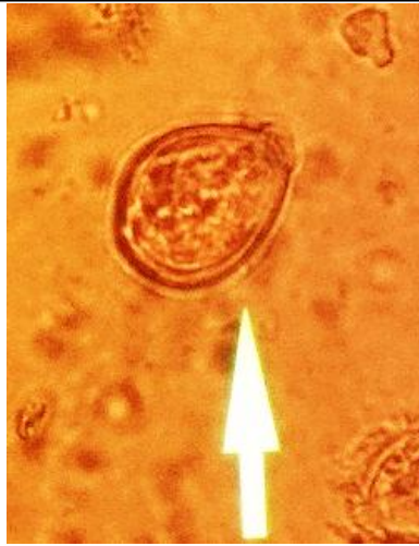
شکل ۹- گونه ایمریا مشاهده شده در مدفوع مارال‌های منطقه حفاظت‌شده آبنالوی استان آذربایجان شرقی با عدسی \times 40 .