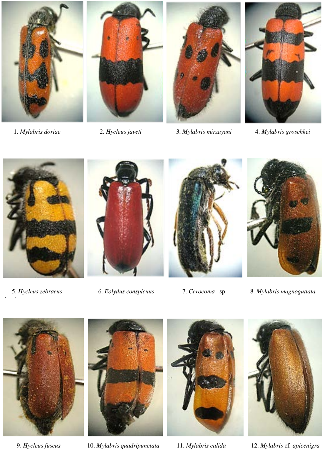
شکل ۳- گونه‌های جمع‌آوری شده از شهرستان اصفهان (اصلی)