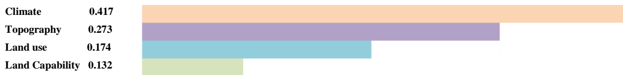
شکل ۱) محاسبه وزن معیارهای بر اساس روش فرایند تحلیل سلسله مراتبی