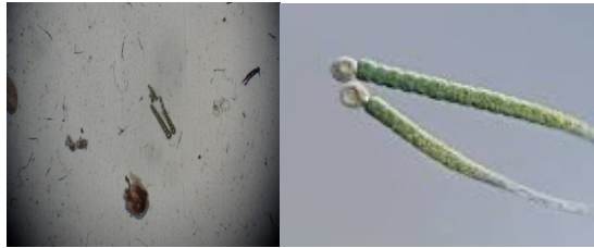
شکل ۲- گونه Gloeotrichia echinulata