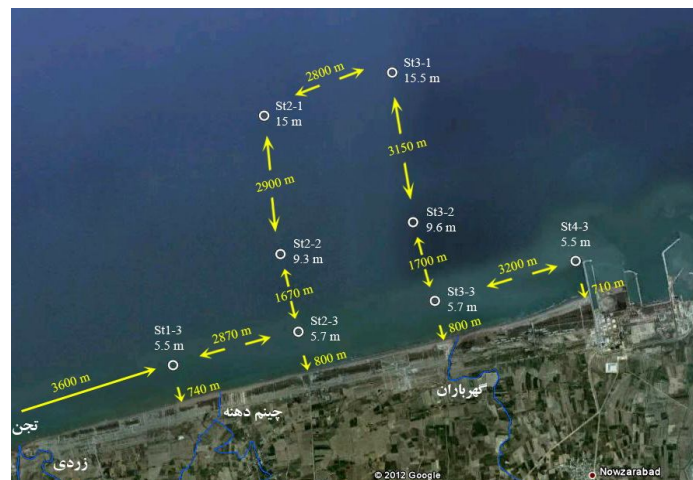
شکل ۱- موقعیت ایستگاه‌های نمونه‌برداری

لایه‌های نمونه‌برداری (تعداد نمونه) در هر ایستگاه با توجه به سوابق و تجربیات به‌دست آمده از فعالیت‌های تحقیقاتی گذشته در دریای خزر، ایستگاه‌های عمق ۵ متر (لایه سطحی)، ایستگاه‌های عمق ۱۰ متر (لایه سطحی و لایه ۵ متر) و