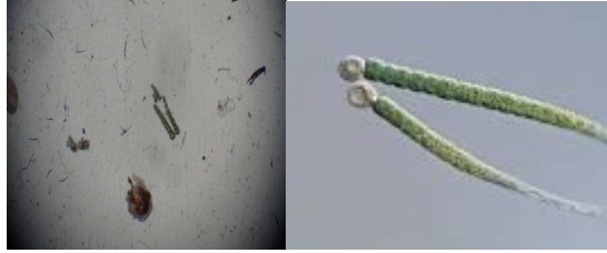
شکل ۲- گونه Gloeotrichia echinulata