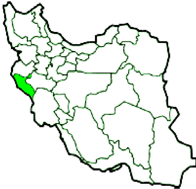
نقشه شماره ۱: تفکیک ایران براساس استان