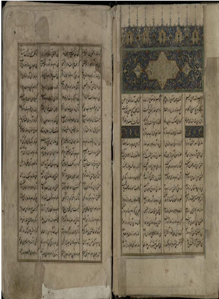
شکل ۲: تصویر شروع نسخه