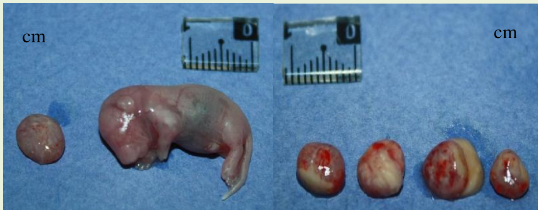
شکل ۱- جنین سالم گروه تجربی I (سمت راست) در مقایسه با شکل ۲- جنین‌های جذبی مربوط به یک موش گروه جنین جذبی گروه تجربی I (سمت چپ) تجربی III