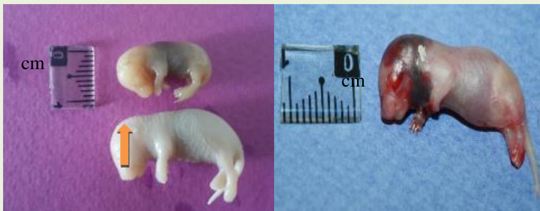
شکل ۳- مقایسه بین جنین گروه شاهد (جنین پائینی) و جنین شکل ۴- جنین گروه تجربی دارای هموراژی

گروه تجربی III (جنین بالا) از نظر طول سری-دمی در ناحیه سر و گردن (فلش).