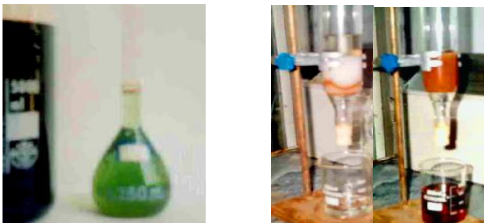
شکل ۱- ستون کروماتوگرافی با سفادکس LH-20 شکل ۲- رنگ سبز ناشی از واکنش تانن متراکم با کلرور فریک

برای اندازه‌گیری تانن‌های قابل هیدرولیز از محلول یک درصد آبی کلرور فریک استفاده شد. پس از جداسازی تانن‌های متراکم از طریق سفادکس، کلرور فریک با تانن‌های قابل هیدرولیز محلول استخراجی تشکیل رسوب آبی رنگ می‌دهد که پس از جداسازی با کاغذ صافی و خشک کردن تحت خلاء رسوب حاصل توزین گردید (شکل ۳). تانن‌های متراکم نیز در تماس با محلول کلروفریک رسوب سبز رنگ تولید می‌کنند (شکل ۲).