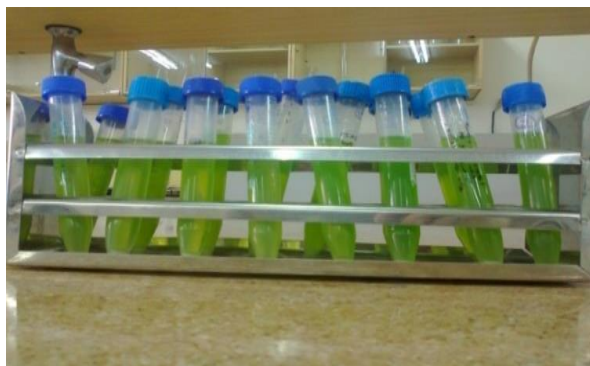
شکل ۱. محلول استخراج شده از برگ سماق

از محلول رویی برای قرائت جذب در طول موج ۶۴۵ نانومتر برای کلروفیل a، طول موج ۶۶۳ نانومتر برای کلروفیل b و طول موج ۴۷۰ نانومتر برای کارتنوئید در دستگاه اسپکتوفتومتر DU530 Beckman استفاده شد. استون ۸۰ درصد صفر کننده دستگاه بود (شکل ۱).