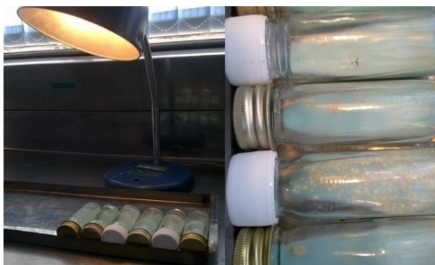
(شکل ۲): آزمایش بررسی پیگمان و کلنی مایکوباکتریوم ها در محیط لوانشتاین _ جانسون

( smegmatis ۳ مورد، مایکوباکتریوم فلاوسنس ( Mycobacterium flavescens ۱ مورد، مایکوباکتریوم تره آ ( Mycobacterium terrea ) ۱ مورد و مایکوباکتریوم آزیاتیوم ( Mycobacterium asiaticum ) ۱ مورد).