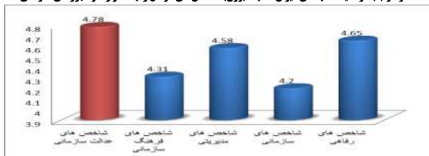
نمودار (۱): وضعیت مقایسه‌ای میزان اهمیت (وزن) شاخص‌های عوامل زمینه‌ساز رفتار شهروندی سازمانی

نمودار بالا گویای آن است که بین شاخص‌های عوامل زمینه‌ساز رفتار شهروندی سازمانی تفاوت معناداری وجود دارد. این امر با توجه به فاصله‌های اطمینان ۹۵ درصدی نشان داده شده در نمودار برای هر شاخص قابل مشاهده است. همچنین بر اساس این نمودار مشاهده می‌شود که پاسخگویان این طور عنوان کرده‌اند که به ترتیب میانگین شاخص‌های عدالت سازمانی، شاخص‌های رفاهی و شاخص‌های مدیریتی از وزن یا اهمیت بالاتری برخوردار است. همچنین شاخص‌های سازمانی و فرهنگ سازمانی کم‌ترین میانگین را کسب نموده‌اند.