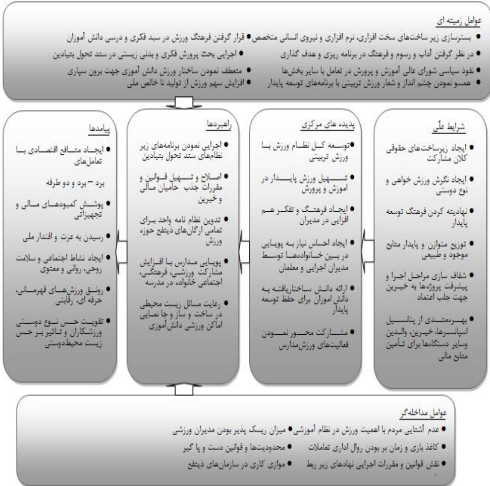
شکل ۱- مدل پارادایمی توسعه پایدار مشارکت ورزش دانش آموزی ایران

در شکل (۱) که مدل پارادایمی برآمده از مصاحبه‌ها و فرایندهای کدگذاری می‌باشد، شرایط علی که دلیلی بر وقوع پیشامدهای مدنظر است با پنج مؤلفه محتوایی مؤثر بر پدیده مرکزی و مقوله‌های اصلی می‌باشد. این قسمت از مدل با پنج عامل زمینه‌ای و هم چنین شش عامل مداخله‌گر به راهبردها منتج می‌شوند. در نهایت در قسمت نهایی مدل راهبردها به پیامدها ختم می‌گردد.