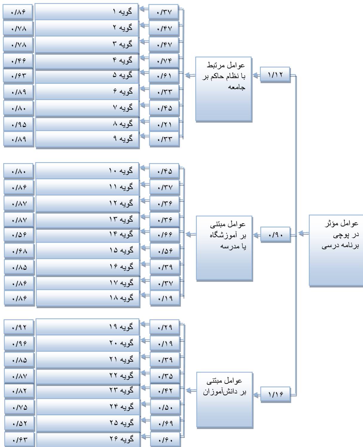
نمودار ۱. تحلیل عاملی تأییدی مرتبه دوم متغیر عوامل مؤثر در پوچی برنامه درسی مدارس مقطع ابتدایی اداره آموزش و پرورش شهرستان مراغه بر اساس بار عاملی