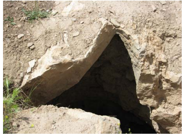
تصویر ۱: نمونه پوشش سقف قبور.