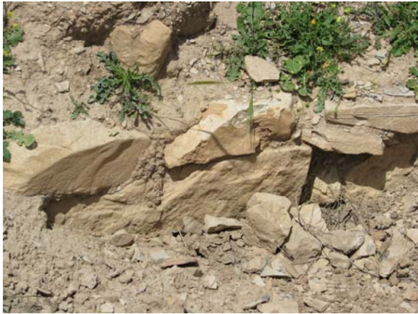
تصویر ۲: نمونه دیواره قبور.