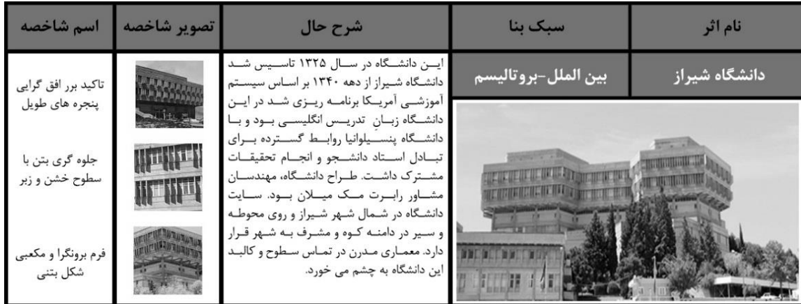
شکل (۴): تحلیل کالبدی دانشگاه شیراز