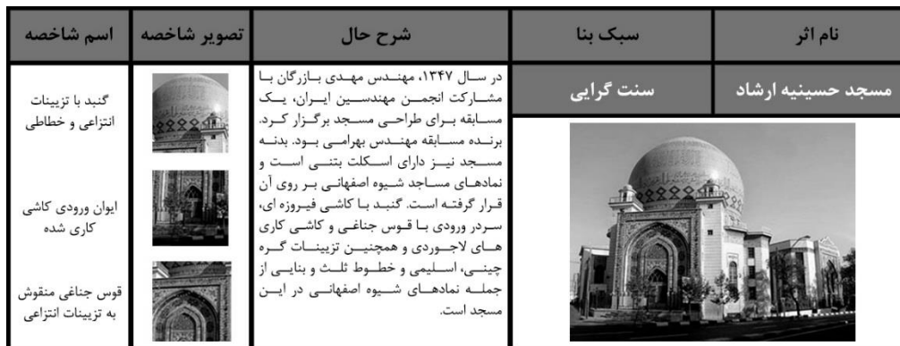
شکل (۲): تحلیل کالبدی مسجد حسینیه ارشاد