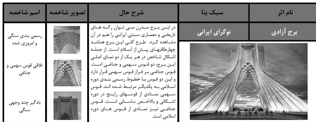
شکل (۹): تحلیل کالبدی برج آزادی