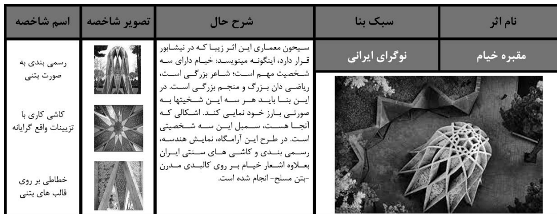
شکل (۸): تحلیل کالبدی آرامگاه خیام

ایرانی که توجه به تمدن فرهنگ و تاریخ ایران داشت در کشور رشد کرد. از این جهت برای این گونه معماری می توان، نام "معماری نوگرای ایرانی" را انتخاب نمود. در ساختمان‌های این سبک، از یک طرف خصوصیات و نوآوری‌های عصر مدرن دیده می‌شود و از طرف دیگر استمرار شیوه‌های معماری گذشته ایران به صورت شفاف و هنرمندانه‌ای در شکل کالبدی بنا متجلی است. پس از وقوع انقلاب اسلامی در سال ۱۳۵۷ اغلب طراحان این ساختمان‌ها به خارج از کشور رفتند. در طرح‌های آنها پس از این زمان، ایده این سبک معماری دیده نمی‌شود. لذا سال ۱۳۵۷ را می‌توان سال پایان معماری نوگرای ایرانی نامید. در ادامه دو اثر مهم از سبک نوگرای ایرانی که به گمان نگارندگان از نظر کالبدی، داده‌های بیشتری را نسبت به سایرین شامل می‌شوند، مورد ارزیابی و تحلیل قرار خواهند گرفت (شکل‌های ۸، ۹).