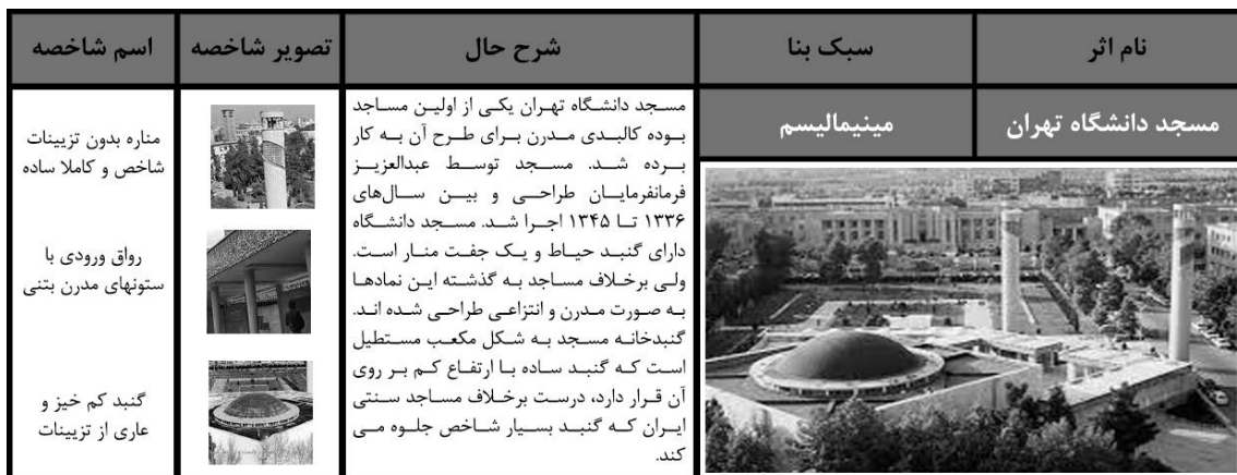
شکل (۶): تحلیل کالبدی مسجد دانشگاه تهران