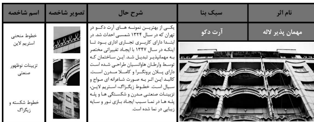
شکل (۳): تحلیل کالبدی مهمان‌پذیر لاله

برخلاف سبک آرت دکو که شکوفایی آن در غرب مربوط به دوره معماری مدرن متعالی است، سبک بین الملل در دوره معماری مدرن متأخر نیز به عنوان یک سبک حائز اهمیت در غرب مطرح بود. این سبک یکی از مهم‌ترین سبک‌های معماری مدرن متأخر محسوب می‌شود. بسیاری از ساختمان‌ها در غرب و اقصی نقاط جهان و منجمله ایران به این سبک ساخته شدند. ولی سه سبک جدید هم در معماری مدرن و تأخیر در غرب مطرح شد که بر معماری ایران نیز، تاثیرگذار بود. این سه به نام‌های تندیس گرایی، بروتالیسم و مینیمالیسم هستند. تندیس گرایی سبکی است که در آن از بتن به مانند خمیر مجسمه سازی برای طراحی و اجرای بدنه ساختمان‌ها استفاده می‌شود. در بناهای این سبک سطح بتن غالباً نمایان است و ساختمان به صورت تندیس‌زیبا به نمایش گذاشته می‌شود. سبک بروتالیسم که از دهه ۱۹۵۰ تا نیمه دهه ۱۹۷۰ میلادی در غرب مطرح بود، سبکی است که در آثار ساخته شده از آن؛ سطح زیر و خشن بتن به نمایش گذاشته می‌شود. بعضاً شیارهای قالب‌های چوبی در سطح بتن نمایان است و معمولاً ابعاد تیرها و ستون‌ها به صورت اغراق آمیز به نمایش گذاشته می‌شود. از سوی دیگر شعار "کمتر بیشتر است" که توسط میس وندروهه مطرح شد، ایده اصلی سبک مینیمالیسم است. در این سبک از خطوط مستقیم و کشیده سطوح صاف و صیقلی و احجام مکعب شکل استفاده می‌شود. اجرای ساختمان و اجزای آن با زیبایی و دقت فوق العاده صورت می‌گیرد. در این سبک از تزیینات خطوط مورب و منحنی و هرگونه اضافاتی که مورد نیاز نباشد پرهیز می‌شود. در ادامه برای چهار مورد از آثار شاخص معماری که بر اساس این سبک‌ها طراحی و اجرا شده‌اند، شناسنامه تهیه (شکل‌های ۳، ۴، ۵، ۶) و از نظر کالبدی مورد ارزیابی قرار خواهند گرفت.