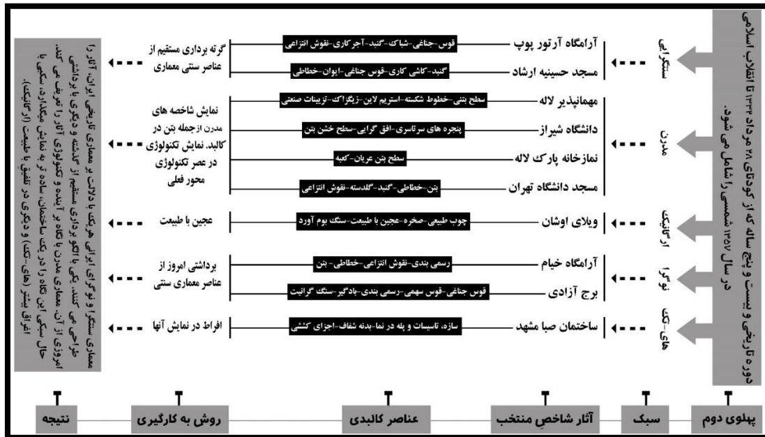
شکل (۱۱): مدل نهایی پژوهش

در دستور کار پژوهش پیش رو، قرار گرفت. پس از مطالعات اسنادی و کتابخانه گسترده، با رویکردی تفسیری-تاریخی به این نتیجه رسیده شد که در دوره پهلوی دوم پنج سبک به نام های "معماری سنتگرایی"، "معماری مدرن"، "معماری ارگانیک"، "معماری نوگرای ایرانی" و "معماری های-تکنولوژی"، به مرحله ظهور رسیدند. با تشریح شاخصه های کالبدی آنها از طریق مشاهدات میدانی مکرر، رفتارهای هر سبک در ساختمان سازی مشخص و ویژگی های کالبدی آثار متصاعد از آنها مورد ارزیابی قرار گرفت (شکل ۱۱).