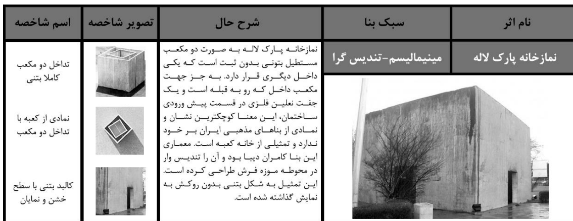
شکل (۵): تحلیل کالبدی نمازخانه پارک لاله