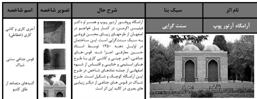
شکل (۱): تحلیل کالبدی آرامگاه آرتور پوپ

و جهان سوم قرار گرفت. استفاده از مصالح، فرم ها و روش های اجرایی سنتی با توجه به مقتضیات جدید (فتیحی، ۱۳۸۲)، موضوعی بود که فتیحی بر آن تاکید داشت و بر آن اساس شهرک "گورنای" جدید را طراحی و اجرا نمود. در ابتدای دوره پهلوی دوم کماکان بسیاری از بناها خصوصاً در روستاها، به شیوه سنتی احداث شدند. ولی روند دوره قبل همچنان ادامه یافت و تدریجاً خانه‌های حیاط مرکزی، حمام‌ها و آب انبارهای سنتی، بلا استفاده و متروک شدند و ساختمان‌های جدید جایگزین آنها شد. اما علی‌رغم به حاشیه رانده شدن معماری سنتی، تعدادی بنای جدید مذهبی و غیر مذهبی به سبک سنت گرایان در این دوره طراحی و اجرا شد که تحت عنوان ساختمان‌ها با معماری هویت‌گرا، مورد مطالعه و تشریح پژوهش پیش رو هستند. شکل ۱ و ۲، شناسنامه‌هایی هستند که از سوی نگارنده برای دو اثر شاخص سنت گرایان این دوره، یعنی؛ آرامگاه آرتور پوپ در اصفهان و مسجد حسینیه ارشاد تهران، تهیه گردیده است.