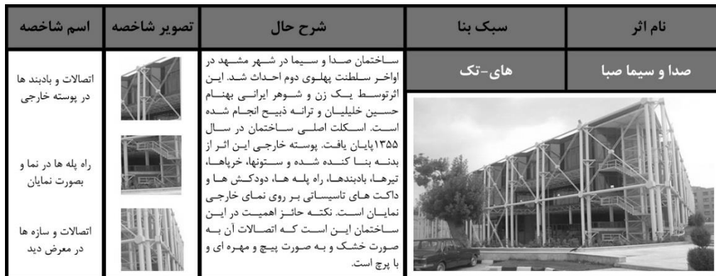
شکل (۱۰): تحلیل کالبدی ساختمان صدا و سیما مشهد

تکنولوژی ساختمان که عمدتاً شامل سازه تاسیسات و سیر کولاسیون است، به صورت شفاف و عریان به تماشا در می‌آید. معماری های-تک نشان‌دهنده دستاوردهای عصر مدرن است. علم و تکنولوژی مدرن یکی از دستاوردهای شاخص این اثر است. در این معماری، پیشبرد حرفه ساختمان سازی با استفاده از فناوری مدرن به صورت هنرمندانه طراحی و در معرض دید قرار می‌گیرد. پس از مطالعات فراوان پیرامون این سبک درد وره پهلوی دوم، مشاهده شد که به دلیل نوظهور بودن معماری های-تک در دوره پهلوی دوم، تنها سه اثر بدین سبک در کشور شناسایی شدند. یکی "استادیوم تختی" تهران، اثر جهانگیر درویش است که به دلیل پوشش دودهانه (دو ستون مرتفع) به فاصله ۲۴۷ متر از یکدیگر، با سقفی بتنی، بواسطه اجزا و کابلهای کششی و دیگری "موزه منطقه‌ای کرمانشاه" اثر مهندسین مشاور مهرآزان، که به دلیل داشتن بدنه شفاف و نمایان بودن سازه، از بهترین نمونه های سبک های-تک در کشور محسوب می‌شوند. اثری بعدی ساختمان صدای و سیما صبا در استان خراسان است که طی شناسنامه زیر (شکل ۱۰)، شاخصه های کالبدی آن مورد ارزیابی قرار خواهد گرفت.