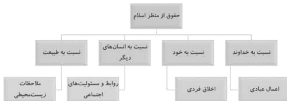
شکل ۱: حقوق حاکم بر زندگی انسان از منظر اسلام (نگارندگان)