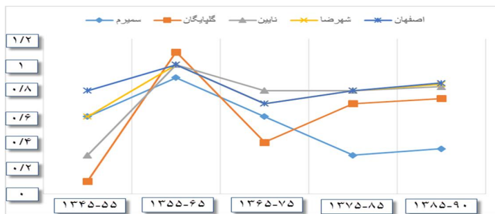
نمودار (شماره ۲) ضریب کشش پذیری جمعیتی در فواصل زمانی ۹۰ - ۱۳۴۵ در سطوح شهری استان اصفهان

**محاسبات نگارندگان *طرح پایه آمایش استان اصفهان، ۱۳۸۹ : ۲۸