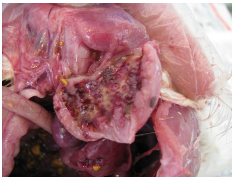
شکل ۱- خونریزی در مخاط پیش معده در اثر فرم ولونژیک احشایی

نهایت در روز ۴۴، تفاوت معنی‌داری بین هر سه گروه مشاهده می‌شد که افزایش تیتراژ گروه دوم نسبت به گروه یک و گروه شاهد معنی‌دار بود. البته در گروه شاهد در این سن عیار مثبتی از نظر آنتی‌بادی علیه بیماری نیوکاسل در آزمایش الیزا وجود نداشت ( p < 0/05 ).