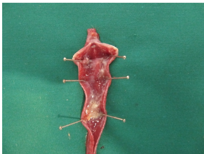
شکل ۶- پرخونی نای به همراه ترشحات در اثر واکنش ناشی از واکسن La Sota