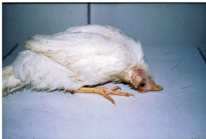
شکل ۴- پیچش گردن در اثر فرم ولوژنیک عصبی