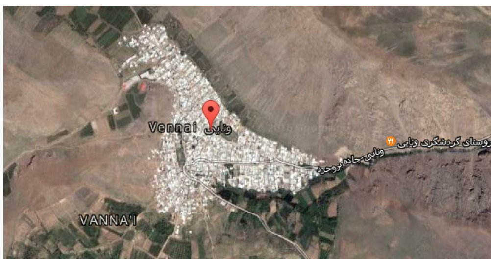
تصویر شماره ۱- موقعیت روستای ونایی