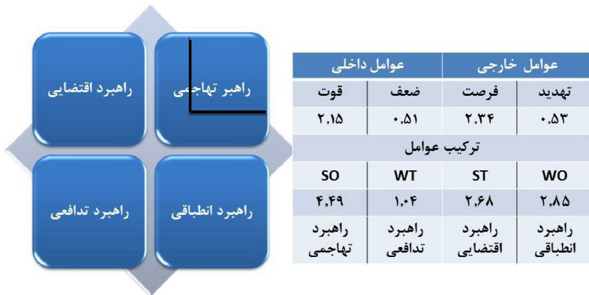
شکل ۱- تعیین راهبرد مطلوب توسعه پایدار گردشگری و ترکیب آن.

تجزیه و تحلیل عوامل درونی (قوت‌ها و ضعف‌ها) و عوامل بیرونی (فرصت‌ها و تهدیدها) حاکی از این است که راهبرد تهاجمی (حداکثر-حداکثر)، با امتیاز ۴/۴۹ به‌عنوان مهم‌ترین راهبرد توسعه پایدار گردشگری در این روستا مطرح می‌باشد. راهبردهای انطباقی (حداقل-حداکثر)، اقتضایی (حداکثر-حداقل) و تدافعی (حداقل-حداقل)، به ترتیب با امتیاز نهایی ۲/۲، ۶۸/۸۵، ۱/۰۴ در رده‌های بعدی قرار دارند. در ادامه، مهم‌ترین موارد در هر راهبرد برای توسعه و پیشبرد موضوع مورد بحث در زمینه به‌کارگیری توسعه پایدار گردشگری در روستای ونایی بیان می‌گردد.