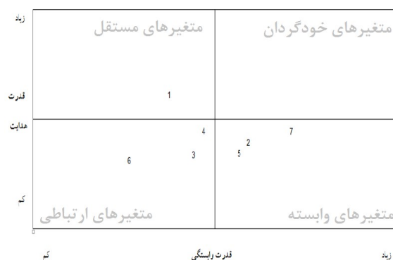
شکل ۲- نمودار قدرت نفوذ - وابستگی برای سازمان مورد بررسی

با توجه به مدل ترسیم شده برای ابعاد مؤثر بر مدیریت داخل سازمانی، ابعاد در چهار سطح قرار گرفتند که عوامل انگیزشی مادی با توجه به دارا بودن بالاترین قدرت و وابستگی متوسط در دسته متغیرهای مستقل (کلیدی)، قرار می‌گیرد و به‌عنوان فونداسیون یا سنگ زیربنای مدل عمل می‌کند و در سطح چهارم مدل قرار می‌گیرد و برای شروع کارکرد سیستم باید روی آن تاکید کرد. سپس عواملی همچون عوامل انگیزشی غیرمادی، دانش و تخصص پرسنل و مدیران و چشم‌انداز و آینده‌نگری سازمانی در رده متغیرهای وابسته بوده که وابستگی قابل توجهی در موفقیت استراتژی‌های مدیریت بازاریابی داخلی دارد. در نهایت عوامل دیگر در رده ارتباطی قرار گرفته‌اند که ارتباط بین عوامل را سبب می‌گردند. این متغیرهای پیوند دهنده غیرایستا هستند زیرا هر نوع تغییر در آنان می‌تواند سیستم را تحت تاثیر قرار دهد و در نهایت بازخور سیستم نیز می‌تواند این متغیرها را دوباره تغییر دهد.