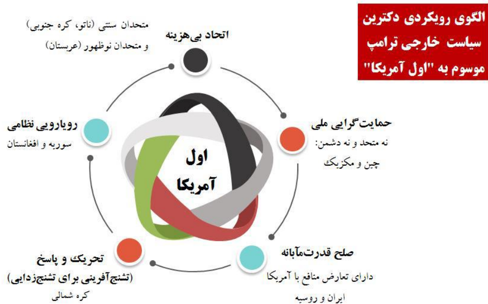
شکل شماره ۱: الگوی رویکردی دکترین سیاست خارجی ترامپ (بیگدلی و خیبری، ۱۳۹۶: ۱۹)