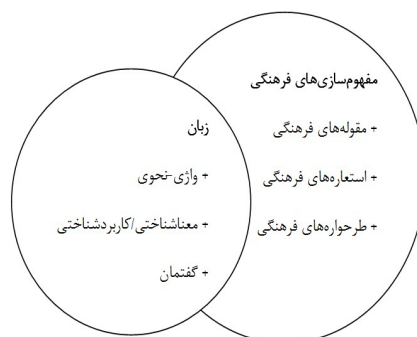
شکل ۲- الگوی تحلیلی (شریفیان، ۱۳۹۷: ۸)

به‌عنوان نمونه، اگر شناخت فرهنگی ما منجر به مفهوم‌سازی از «ابزار» شود، هر آنچه ادراک می‌شود را ذیل همان فرهنگ از مجرای طرح‌واره‌ها، مقوله‌ها و استعاره‌های فرهنگی از ابزار تمیز و یا با آن تطبیق می‌دهیم. در همین راستا و در قالب مثالی دیگر چنین می‌توان گفت که آن مفهوم‌سازی از زن که ذیل ابزار شکل بگیرد، شناخت فرهنگی سخنگویان جامعه متبوع را در مقوله‌بندی او در قالب ساختار اعضای مقوله ابزارآلات می‌تواند نشان دهد. از تعامل این دو الگو ما به یک نظام تبیینی می‌رسیم که بر اساس آن می‌توانیم ویژگی‌های نحوی، ساختارزی، واجی/آوایی، معناشناختی، کاربردشناختی و گفتمانی واژگان را از روی روابط مقوله‌ای تأویل کرده و شناخت فرهنگی جامعه زبانی متبوع را شناسایی و ارزیابی کنیم.